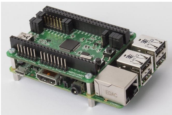
Gambar 3. Contoh gambar dengan resolusi cukup