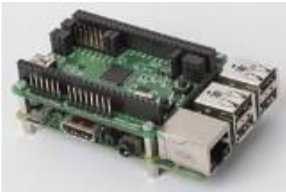
Gambar 2. Contoh gambar dengan resolusi kurang

Gambar diberi nomor dengan menggunakan angka. Keterangan gambar harus dalam font tebal (bold) ukuran 10 pt. Keterangan gambar harus diletakkan di tengah ( centered ). Keterangan gambar dengan nomor gambar harus ditempatkan setelah gambar terkait, seperti yang ditunjukkan pada Gambar 1.