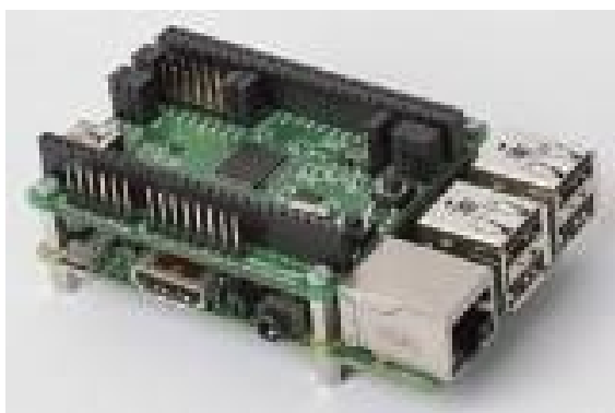
Gambar 2. Contoh gambar dengan resolusi kurang